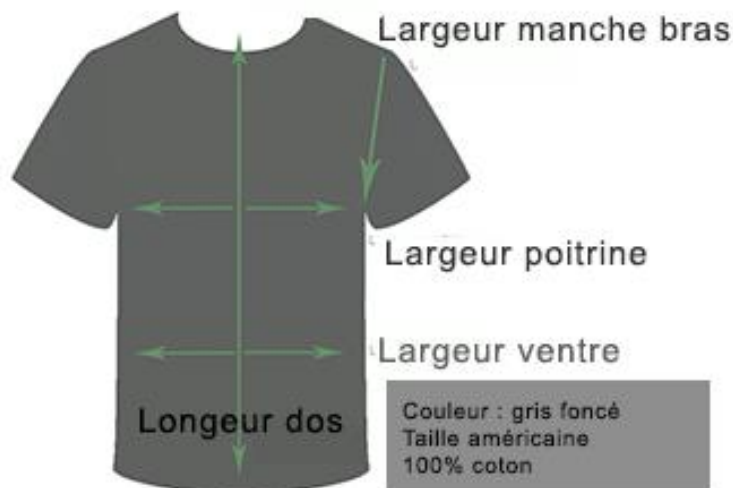
Modèle HOMME Gris foncé